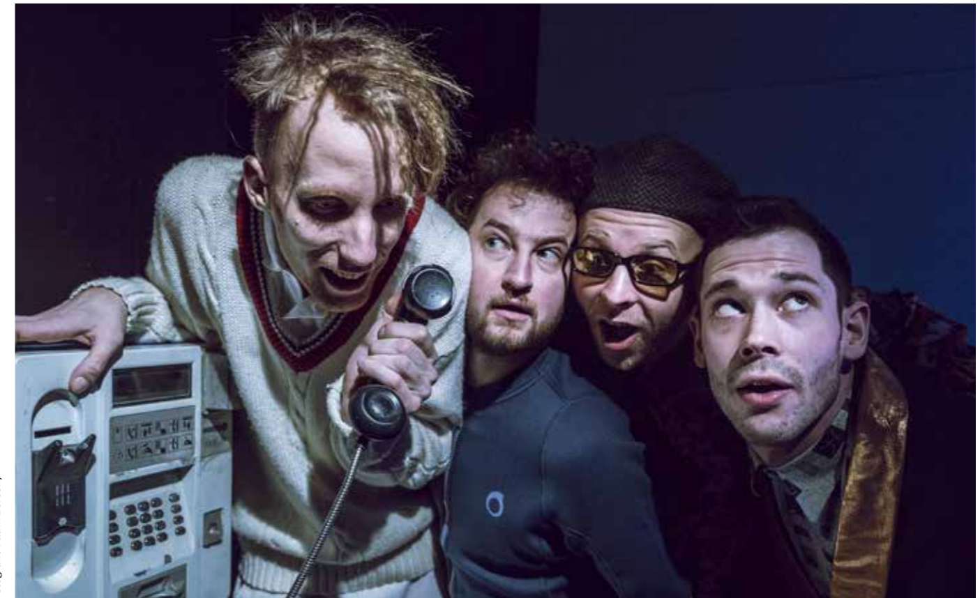
Fotografie Patrik Borecký